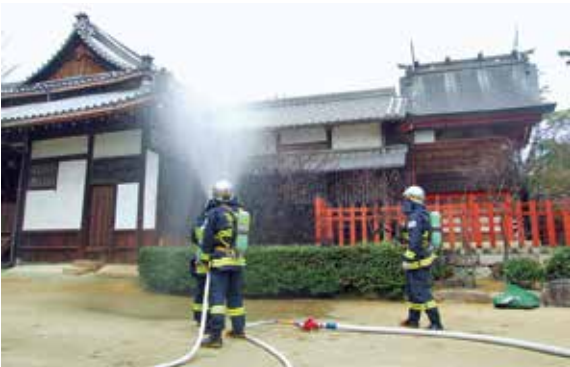
昨年度の風景「佐太天神宮」