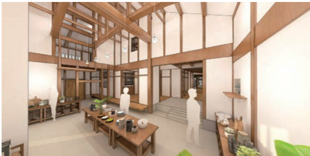
※旧徳永家住宅と活用イメージ