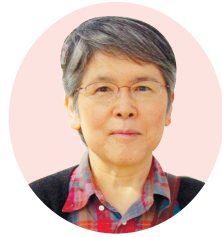
ジャーナリスト 細見三英子