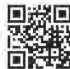
ラブラッド 会員登録