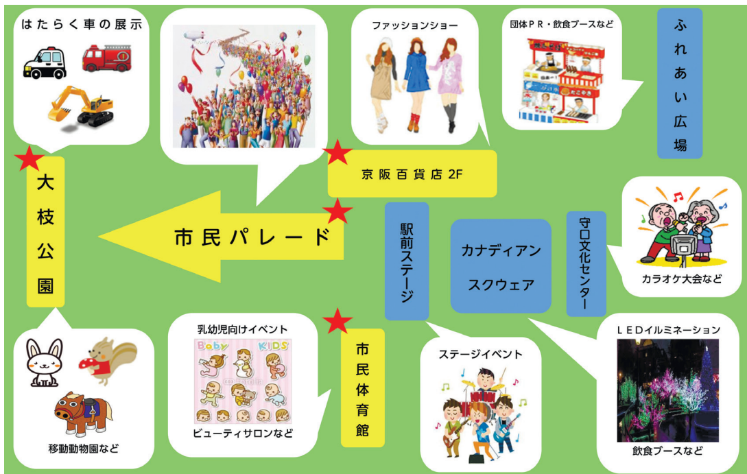
イベント会場図(案)

守口市民まつり実行委員会 事務局(地域振興課内) TEL 06・6992・1516