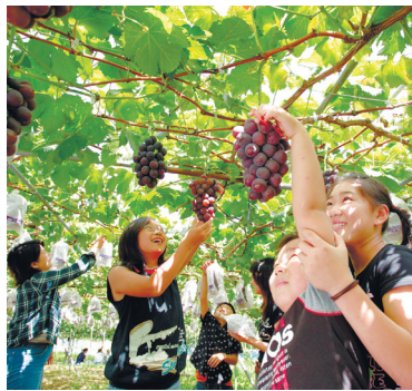
○和歌山県かつらぎ町

生見 いくみ 海岸があり、マリンスポーツやハイキング・キャンプ・海水浴・投げ釣り・磯釣りなどが思う存分に楽しめます。