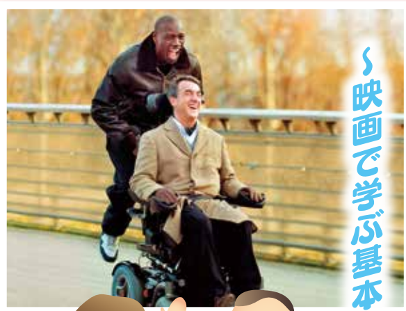
映画で学ぶ基本的人権