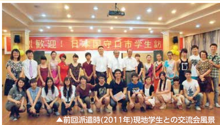
▲前回派遣時(2011年)現地学生との交流会風景