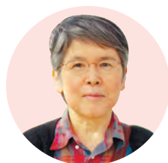
ジャーナリスト 細見三英子