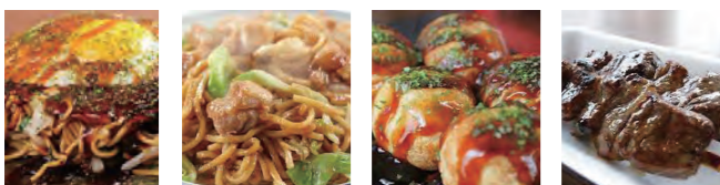
広島焼き 蒜山焼きそば たこ焼き ジャンボ牛串