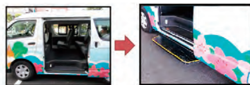
電動ステップ設置