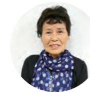
ラジオネーム 桜ちゃん

ふさぎ込んでた時、ラジオの向こうから元気なパーソナリティさんの声。私も電話で好きな曲をリクエスト。すると30分もたたないうちに曲が流れ始めました。嬉しかった。あれから20年、ぞっこんです。いつも感謝。