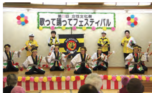
昨年11月に行われた「女性文化祭」の様子

守口市内の商店街や商店の協力店で老人クラブ会員証を提示すれば、割引などを受けられる制度も実施しています。