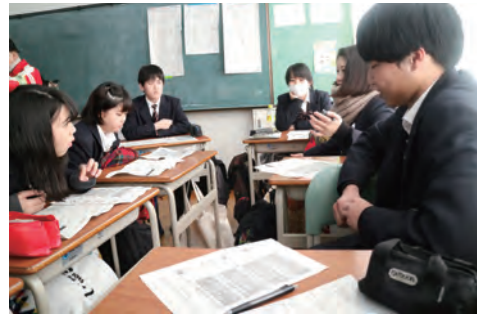
政治的教養を育む(グループワーク)

1月11日、大阪府立守口東高等学校の2年生(16～17歳・249人)を対象に選挙に関する出前講座と模擬選挙を実施しました。