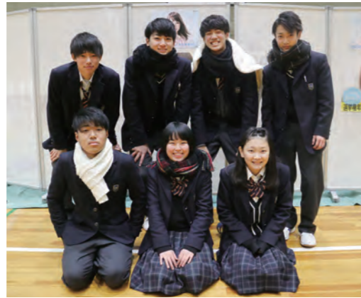
選挙事務を経験した生徒の皆さん