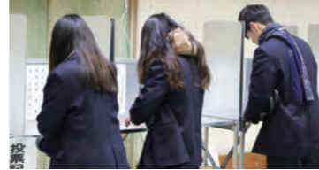
自分の意思をしっかりと！