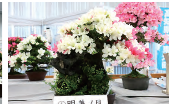
緑・花協会賞「明美ノ月」