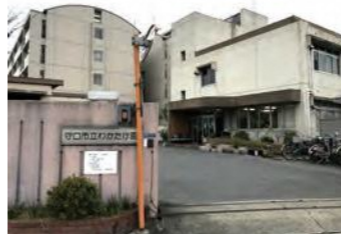
守口市立わかたけ園

○障がい者相談支援事業 障がいのある人や障がい児の保護者からの相談に応じ、必要な情報の提供・助言・障がい福祉サービスの利用援助などを行います。