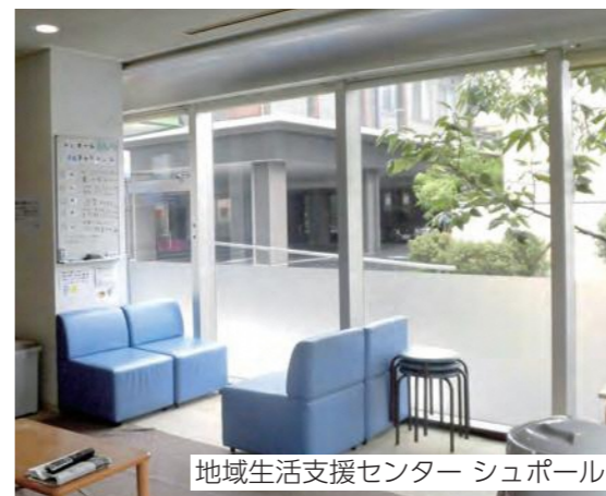
地域生活支援センター シュポール