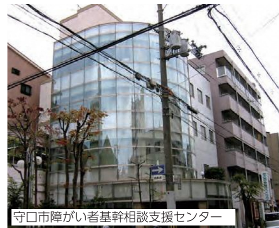
守口市障がい者基幹相談支援センター

7ページと8ページに掲載している各窓口相談に関するページは、切り取り線で切っていただき、目の付くところに貼っておくなど、適宜活用ください。