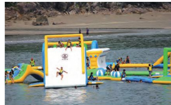
ビーチホッピングの様子

備 かつらぎ町子ども交流会は、かつらぎ町の受け入れが困難なため中止になりました。