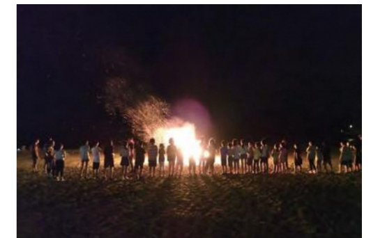
平成31年度のキャンプファイヤーの様子