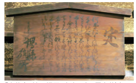
「高札(五榜の掲示、慶応4年、個人蔵)」

問 生涯学習・スポーツ振興課 TEL 06-6995-3158 「明治維新」150年~守口市の幕末維新~というテーマで、150年前の「明治維新」が守口市ではどのような影響があったのかを史料から振り返り、その中で得たものや失ったものを考えます。 時 10月2日(火)~5日(金)9:00~17:00(入室は16:30まで。最終日は12:00まで) 場 市役所1階南エリア会議室104 注 団体(10人以上)の見学は要連絡 備 5日(金)10:00より展示解説を行います。