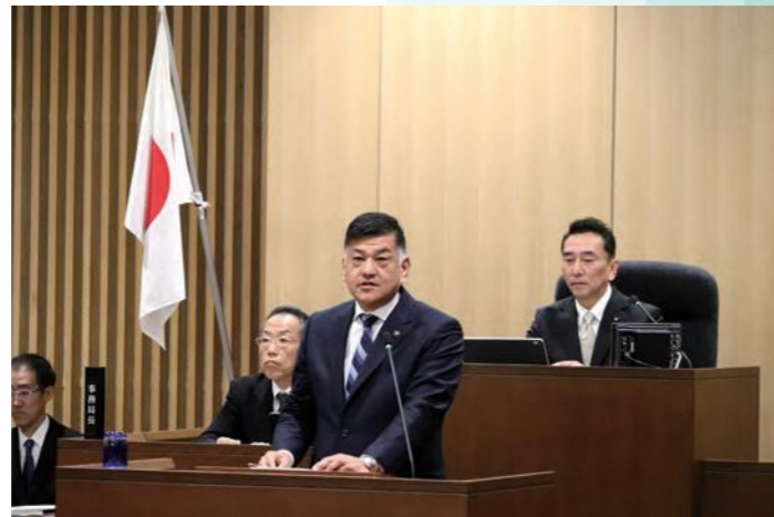
～市議会と力を合わせて緊急対策に取り組んでいます～