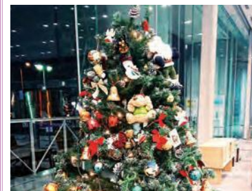
#もリスマイル #クリスマスイブ #クリスマスツリー #飾り付け #冬

アカウント moriguchi_smile 守口市にあるさまざまなスマイル(景色、人、モノなど)をハッシュタグもリスマイル(#もリスマイル)を付けて投稿してね。その中から、リポスト(シェア)させていただくこともあります。