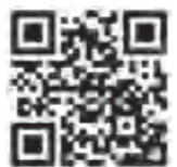
ハザードマップポータルサイト

水害・土砂災害情報統合ポータルサイトが開設されています。台風をはじめ、風水害への事前の備えを行うための情報としてご覧ください。 水害・土砂災害情報統合ポータルサイト (https://www.river.go.jp/port al/)