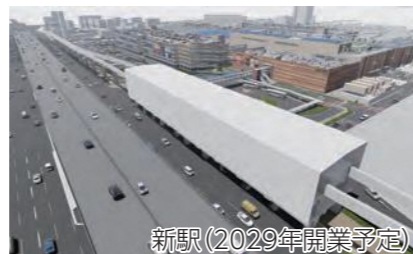
↑新駅のイメージ図。北東を望む。