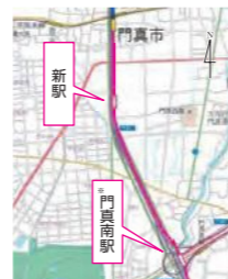
図中の※は「仮称」です。