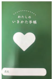
わたしのいきかた手帳