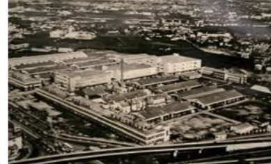
昭和40年代の大日周辺

守口市75周年記念特別展示 守口市のあゆみ 過去~現在 問 魅力創造発信課 TEL 06-6992-1356 昭和21年11月1日に守口市制が施行され、今年で75年を迎えます。これを記念して、守口市のこれまでのあゆみを、当時の広報紙(誌)や貴重な写真、資料から振り返ります。 時 11月12日(金)~28日(日) 場 市立図書館1階郷土資料展示室 備 展示時間・休館日は図書館に準じます。