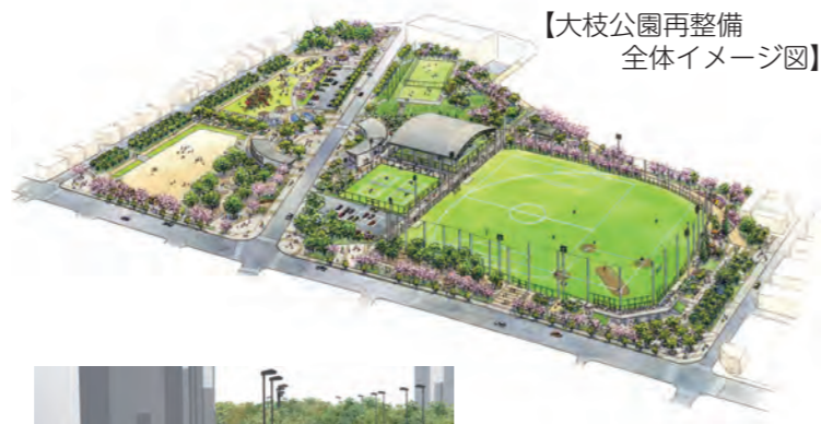
【大枝公園再整備 全体イメージ図】

平成28年度に施工した多目的球技場に引き続き、平成29年度はテニスコートや西側パークセンター、災害時に避難者や支援車両が円滑に通行できる園路、防火樹林帯、防火水槽やマンホールトイレなどの工事を行います。