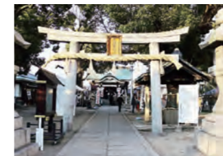
産須那神社 「地元の神様！」