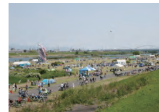
淀川河川公園 「自然もイベントもいっぱい！」