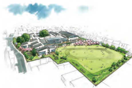
「最優秀者が提案したさくら小学校のイメージ図」