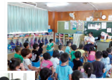
保育所での中学生によるよみきかせ会