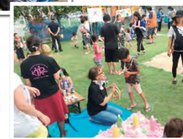
わかくさ・わかすぎ園の夏祭りイベント