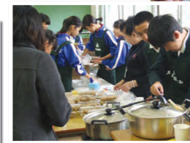
庭中フェスタで防災食の準備をする地域コーディネーターと中学生