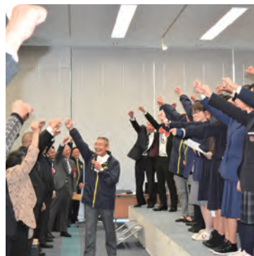
昨年度実施の様子

場 市役所1階大会議室 定 300人 申 不要 問 健康福祉部総務課 TEL 06・6992・1570 問 守口市更生保護サポートセンター TEL 06・7897・7036