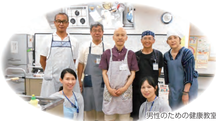
男性のための健康教室

野菜は火を通したものであれば、かさが減って摂取しやすいです。緑黄色野菜と淡色野菜を1:2の割合で摂ることが好ましいです。毎日の食生活の積み重ねが大事。レシピや健康教室開催の情報などは、気軽にお尋ねください。