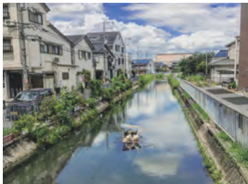
リポストした投稿が最多いいね! #アヒル小屋 #守口百景

アカウント moriguchi_smile 守口市にあるさまざまなスマイル(景色、人、モノなどなど)をハッシュタグもリスマイル(#もりスマイル)を付けて投稿してね。その中から、リポスト(シェア)させていただくこともあります。