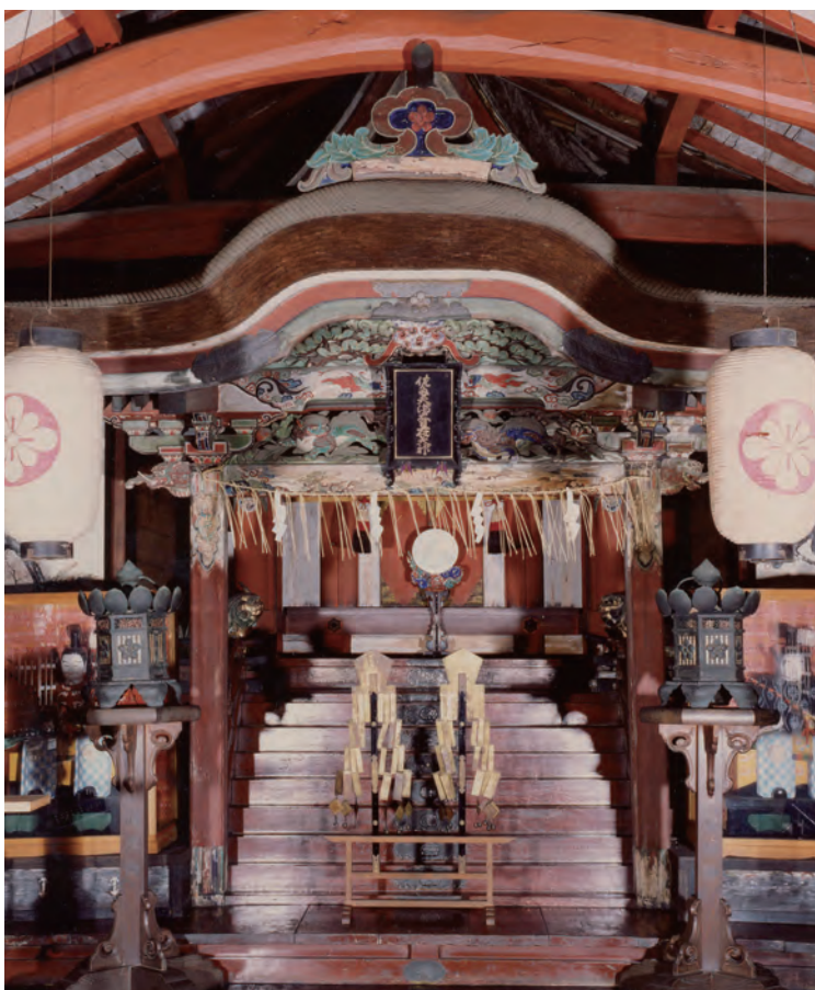
〈府指定有形文化財〉 (佐太天神宮)「佐太天神宮本殿」 指定年月日 平成15年1月31日