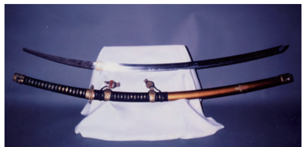
〈府指定有形文化財〉 (佐太天神宮)「佐太天神宮太刀(非公開)」 指定年月日 昭和45年2月20日

備 「佐太天神宮「紙本着色天神縁起絵巻」図録」は、市教委・生涯学習課で、1冊1,600円で頒布しています。