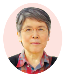
ジャーナリスト 細見三英子