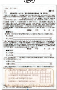
必要に応じ再利用