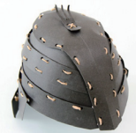
ペーパークラフト 「古代のかぶと」