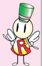
守口市ごみ減量キャラクター「くりあ」