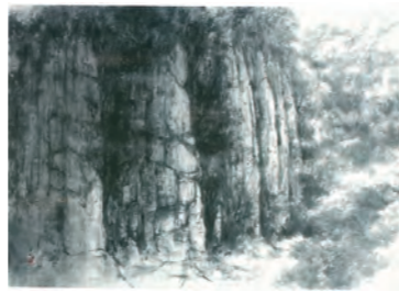
潮見沖天作「富郷溪谷」