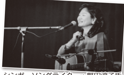
シンガーソングライター・野田淳子氏