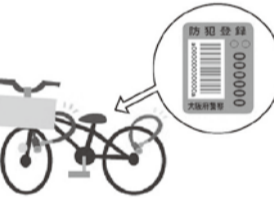
防犯登録に関する問合せ先 大阪府自転車商防犯協力会 (☎6629・0750) http://www.bouhanku.com/

○一度電話を切って、正式な公的機関の窓口で電話をかけ直して事実を確認しましょう! ○ATMの操作をするときは、金融機関職員などに相談しましょう! ATMでお金が戻ってこない場合は絶対に取りません! 問合せ先 危機管理課 (☎6992・1496)