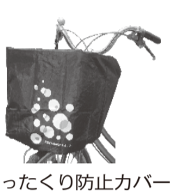
ひったくり防止カバー

被書認知状況 60歳以上の被害が多く発生しています。 自転車の前かごからや、歩いている時の被害が多くなっています。 ○「ひったくり防止カバー」を活用しましょう!