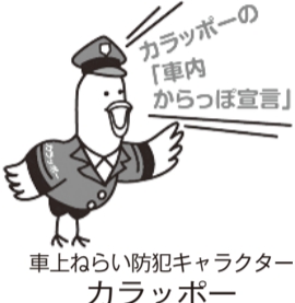
車上ねらい防犯キャラクターカラッポ

短時間での駐車でも被害にあうケースが多くなっています。 貴重品がなくても、車の中のものに被害にあう場合があります。 ○車内には何も無い状態、「車内をからっぽ」にしましょう!