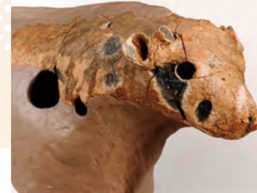
牛形はにわ(市指定有形文化財)