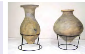
長池町遺跡出土弥生土器(市指定有形文化財)