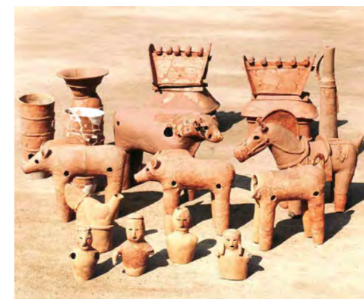
けいしょうはにわ(市指定有形文化財)

その他に、長池町遺跡からは弥生時代中期の櫛形流紋が施された壺が、八雲遺跡からは奈良時代の人面墨搦土器など、市内の遺跡からは人の営みを示す出土遺物(埋蔵文化財)が多く発見されています。