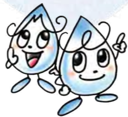
守口市水道局 マスコットキャラクター