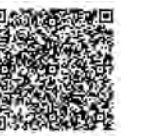
守口市地球温暖化 対策実行計画 (区域施策編)