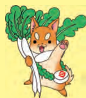
視聴はこちらから