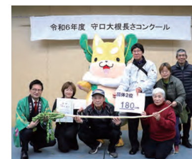
団体の部第2位 180cm 守口市立さくら小学校