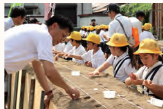
守口大根の種だよ！