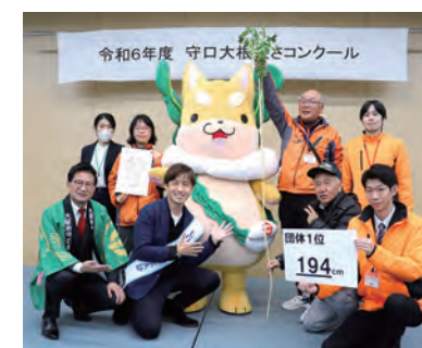
団体の部第1位 194cm 八雲東地域コミュニティ協議会 八雲東コミュニティセンター