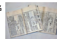
わかんさんざいずえ 和漢三才図会