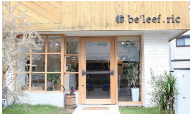
技術協力: be'leef.ric(ビリーフ リック)