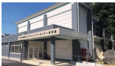
南部エリアコミュニティセンター体育室