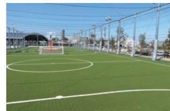
フットサルコート