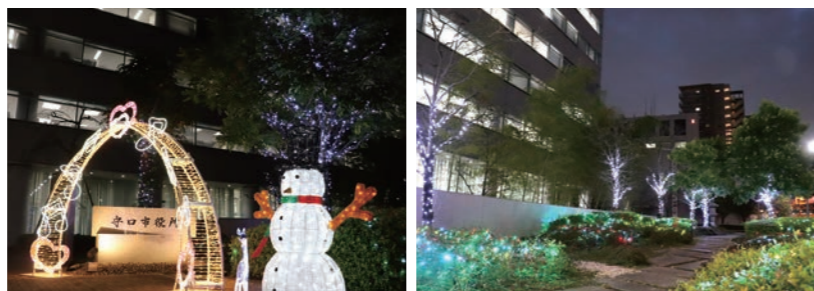
守口市役所庁舎庭園イルミネーション