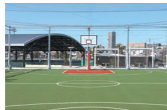
バスケットボールコート