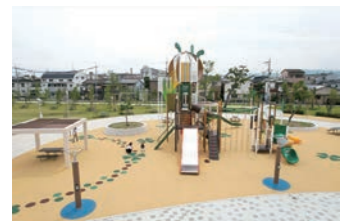
幼児・児童遊具広場