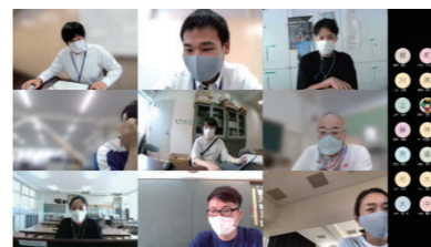
学力向上推進委員会会議(Web)の様子