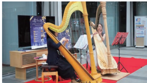
光かがやく冬のクラシックコンサート(ロビー)