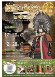
謎解き宝探しin守口市