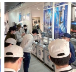
企業訪問バスツアー