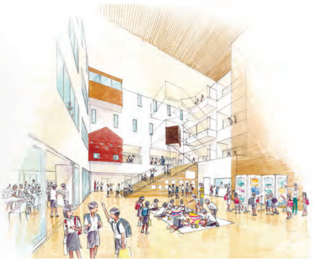
吹き抜けホール(イメージ図)