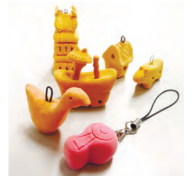
埴輪ストラップ作成例

TEL 06-6995-3158 Mori_shougaiaku@city-moriguchi-osaka.jp