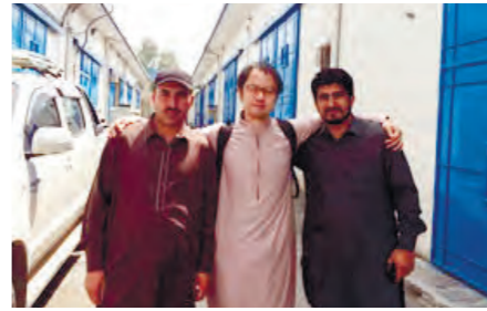
パキスタンで現地スタッフとともに(写真中央)

時 8月5日(金) 場 中央コミュニティセンター 内 ▽午前10時30分 アニメ映画「ふるこのこころ」 ▽午前11時 被爆体験おはなし会 ▽午後1時30分 記念講演会「医療の届かない場所へ」人道支援組織、国境なき医師団の活動」 講 守口市原爆被害者の会 ▽午前11時45分～午後1時 戦中食(すいとん)試食体験 当日午前10時から、先着100食の整理券配布 申 関人権室 TEL 06・6992・1512