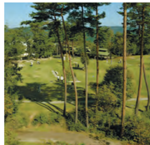
高島市・くつきの森

さと村」があり、周辺の遊歩道では自然を満喫できます。宿泊施設でのんびり過ごしたり、スポーツを楽しめるテニスコート、グラウンドやキャンプ場があります。