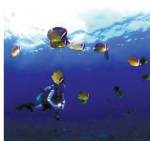
東洋町・生見の海

高知県最東端の町で、室戸阿南海岸国定公園の真ん中に位置する、海・山・川に恵まれた町です。