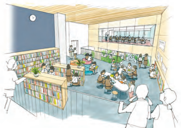
メディアセンター(イメージ図)