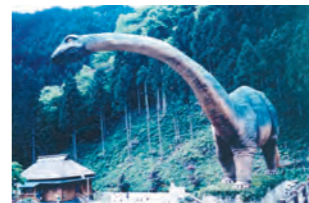
かつらぎ町・恐竜ランド

和歌山県かつらぎ町 高野山のふもと、清流有田川の渓谷に位置する花園は、一年を通じて数多くの美味しいフルーツが採れ、美しい自然と収穫・味体験が楽しめます。