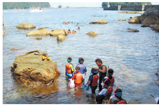
シュノーケリング体験