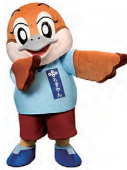
大阪府広報担当副知事 もずやん