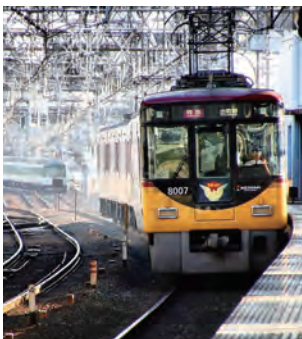
#おけいはん #京阪8000系 #もりスマイル

11月5日、守口市民まつりで行いました、Moriguchi_smileフォトコンテストで、合計776票の投票のうち、79票集めた@takabon_express8823さんがベストいいね!に輝きました。