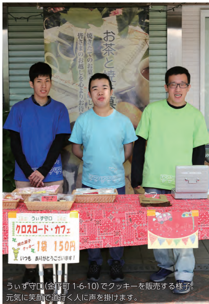
ういず守口(金下町 1-6-10)でクッキーを販売の様子。 元気に笑顔で道行く人に声を掛けます。

一歩踏み出す 知的障害は症状や程度によってさまざまです。知的障害のある人との意思疎通で大事なものは、お互いに一歩踏み出すこと。どうしても話しかけにくいといったイメージを持ってしまいがちです。また、障害のある人は狭いコミュニティーに引きこもることが多くなってしまう。 知的障害の人と、その保護者への支援を行っていく上で、就労支援は障害者の自立と社会参加に欠かせないものです。