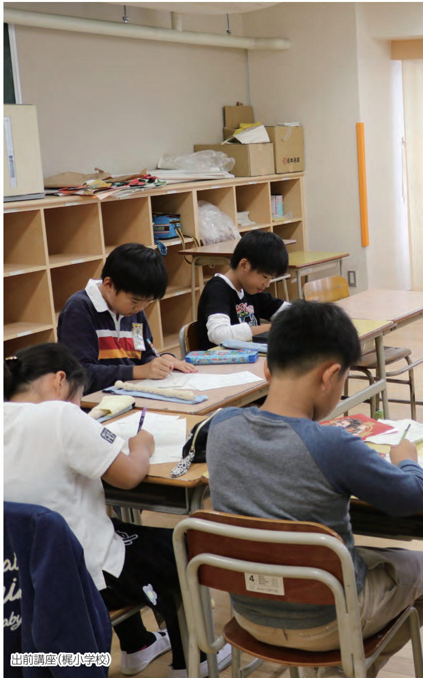
出前講座(梶小学校)

障害者差別的禁止、社会的障壁の除去及び必要かつ合理的な配慮 障害のある人もない人も、ともに支え合う社会を実現するため、障害に対する理解を促進し障害のある人が日常生活、社会生活を送る上で妨げとなる社会的障壁の除去に努めます。 多様な主体による協働 障害のある人の抱える課題は、多様化・複雑化しており、ひとつの支援についても複合的な主体を必要とすることが多くなっています。今後、ますます多様化・複雑化していくニーズに対して、家族や事業者だけでなく、市民とボランティアなど多様な主体が協働することで取り組みます。 ライフステージや障害特性等に配慮した切れ目のない支援 障害のある人が住みたい場所で安心して生活していくため、当事者の年齢や障害種別、取り巻く環境によって生じる支援の格差を解消し、ニーズを起点とした支援体制の構築に努めます。