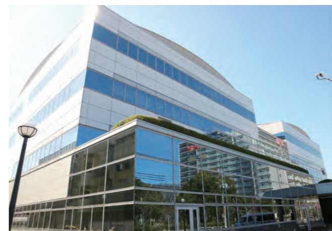
市民保健センター正面玄関に入って右側にあります