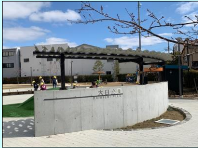
市立図書館整備事業