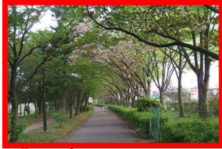
●自然散策ゾーンイメージ