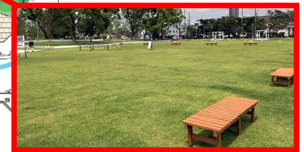
●芝生広場イメージ