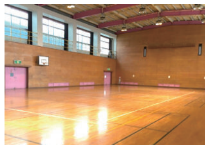
錦コミュニティセンター体育室

だが、昨今の猛暑も踏まえ、利用者の安全確保の観点から、全ての体育室への空調設備の早期設置に向けて鋭意取り組むこと。