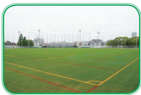
大枝公園多目的球技場

施設使用料は、旧市民球場などと比べ、高い設定となっているが、再整備による施設の機能性や利便性向上を周知することにも、維持費などを勘案した料金設定の妥当性など十分な説明に配慮し、市民の理解を得られるよう努