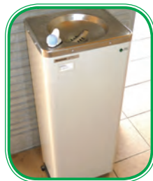
ウォータークーラー

今後既に設置している機器の衛生管理の徹底を図るとともに、近年の熱中症対策等の一環として、小学校も含め未設置校についても設置基準等を策定し、学校現場の意見を聞きながら導入を図るべく検討していく。