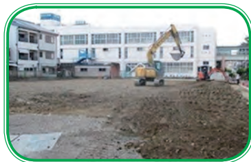
旧市立とうだ幼稚園跡地

旧市立とうだ幼稚園の跡地に平成30年4月開園予定である(仮称)東部市立認定こども園の新築工事請負契約を締結するものです。