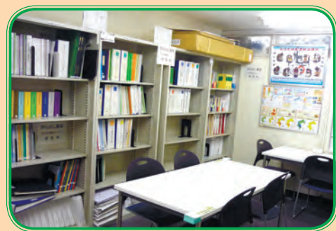
情報コーナー(市役所1号別館2階)

平成27年度分の政務活動費収支報告書及び領収書等を情報コーナーにおいて公開しています。また、政務活動費収支報告書については、市議会ホームページにも掲載しています。