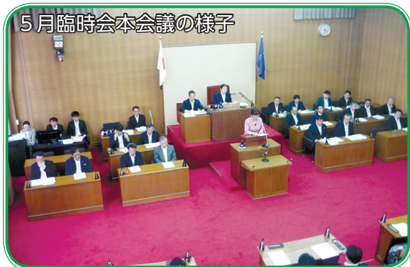
5月臨時会本会議の様子