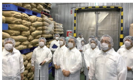
市議会による納入業者の現地視察の様子

新たな納入業者では、どの工程においても厳正な衛生管理を行っており、現在提供されている学校給食の白米が、安全で安心できるものであることを確認しました。