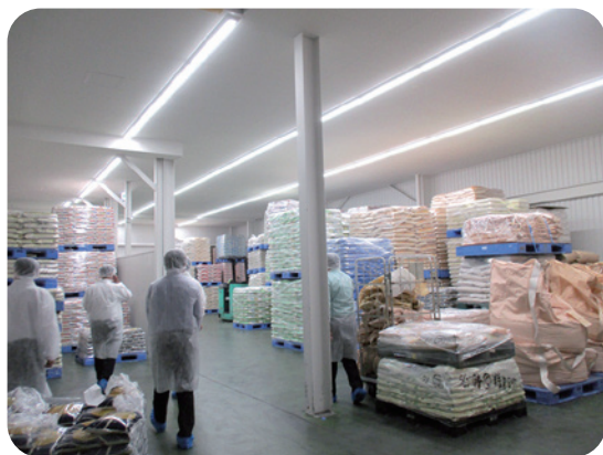
教育委員会による納入業者への現地調査の様子