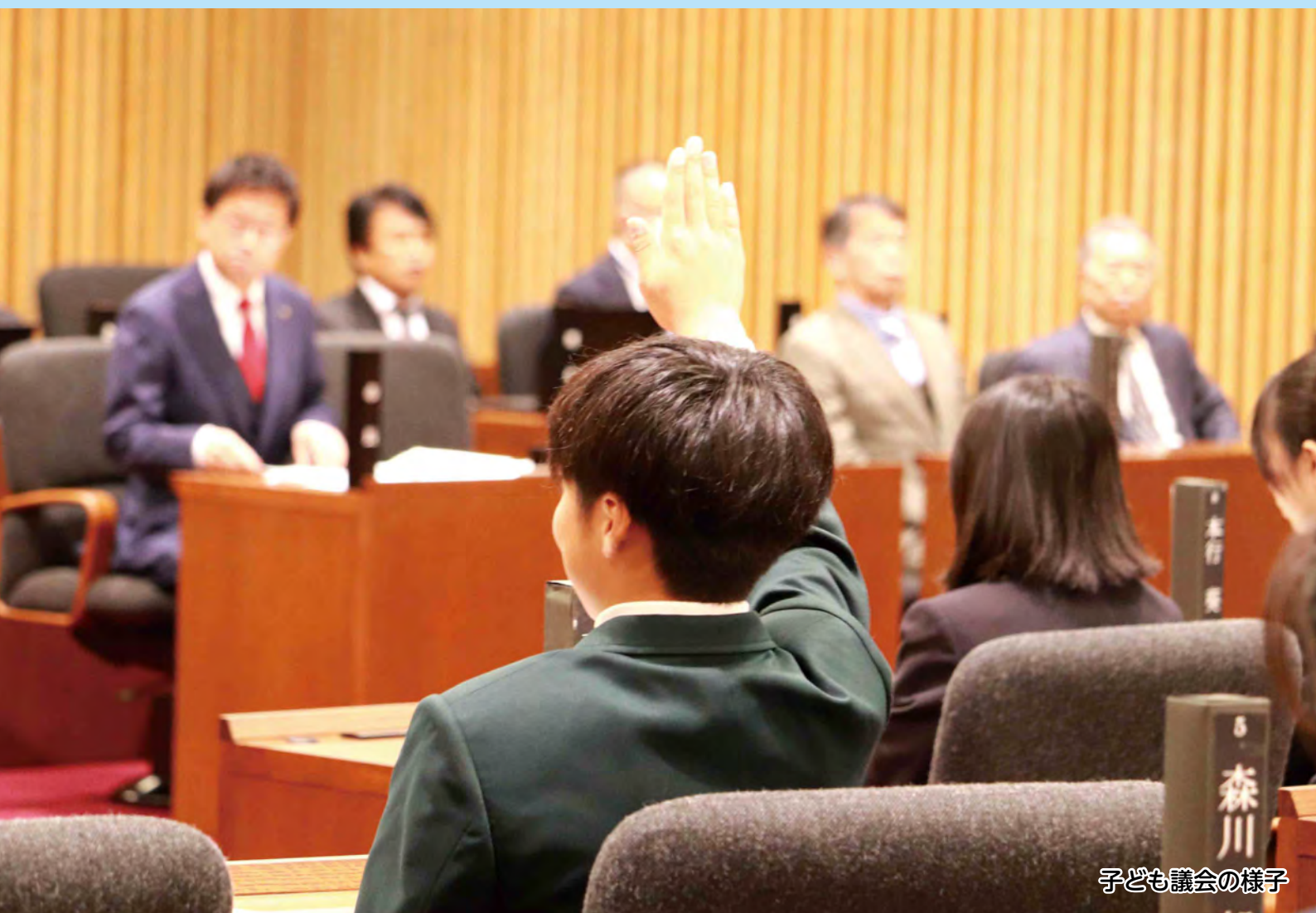
子ども議会の様子