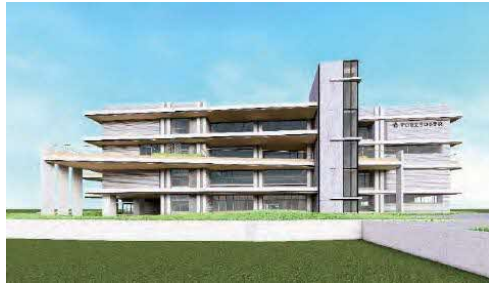
守口小学校の新校舎完成予想図