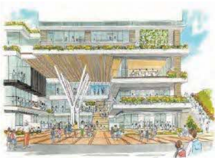
義務教育学校の校舎完成予想図

工事の実施にあたっては、歩行者などの安全確保や周辺地域対策に万全を期すことなどの意見がありました。