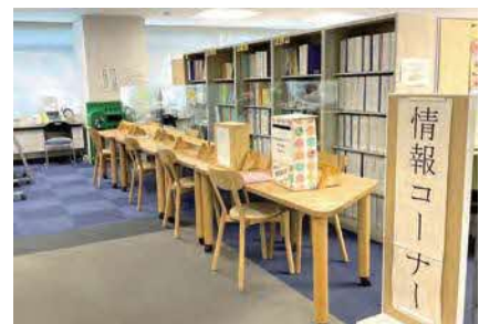
情報コーナー（市役所2階北エリア）