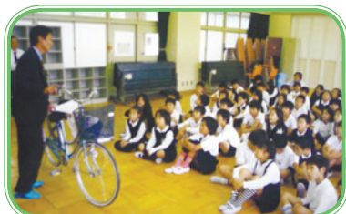
小学校で行われる交通安全教室

本市では、リーフレットを市内の小・中学校等に配布し、自転車の安全運転について啓発に取り組んでいる。今後、警察と連携して、市内で開催する安全運転講習会等を通じて、条例等の周知を図るとともに、児童等を対象とした安全運転教室を行うなど、安全な自転車利用促進に努めていく。