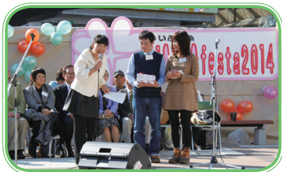
昨年のいい夫婦フェスタ2014の様子