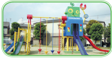
遊具が新しくなった金田公園

公園の施設改修は、公園施設の大部分が老朽化している中、公園施設長寿命化計画に基づき、平成26年度から遊具等の更新を実施している。また、再整備については、花と緑の基本計画に基づき、地域の拠点となる公園を中心に、多様なニーズに対応した公園づくりを検討している。