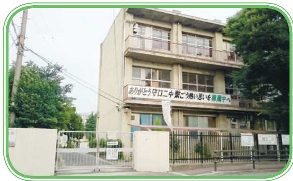
解体される旧第二中学校