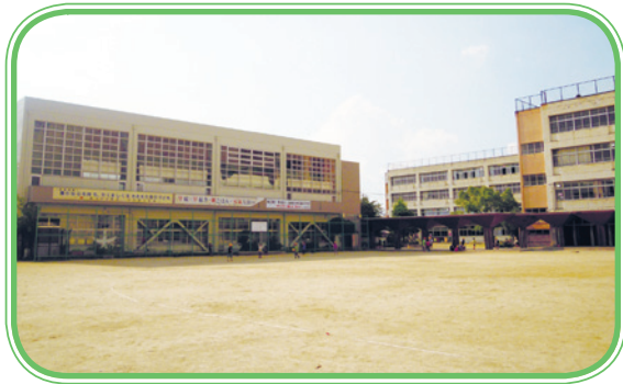
新校舎建設予定の大久保小学校