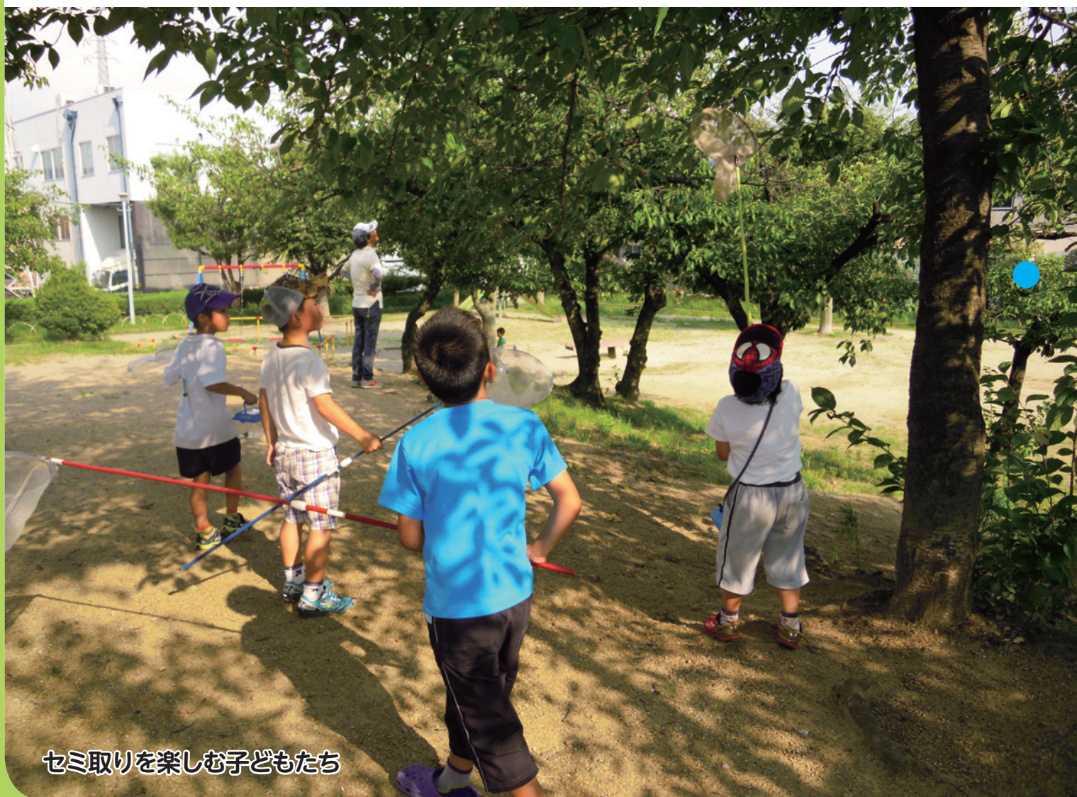
セミ取りを楽しむ子どもたち